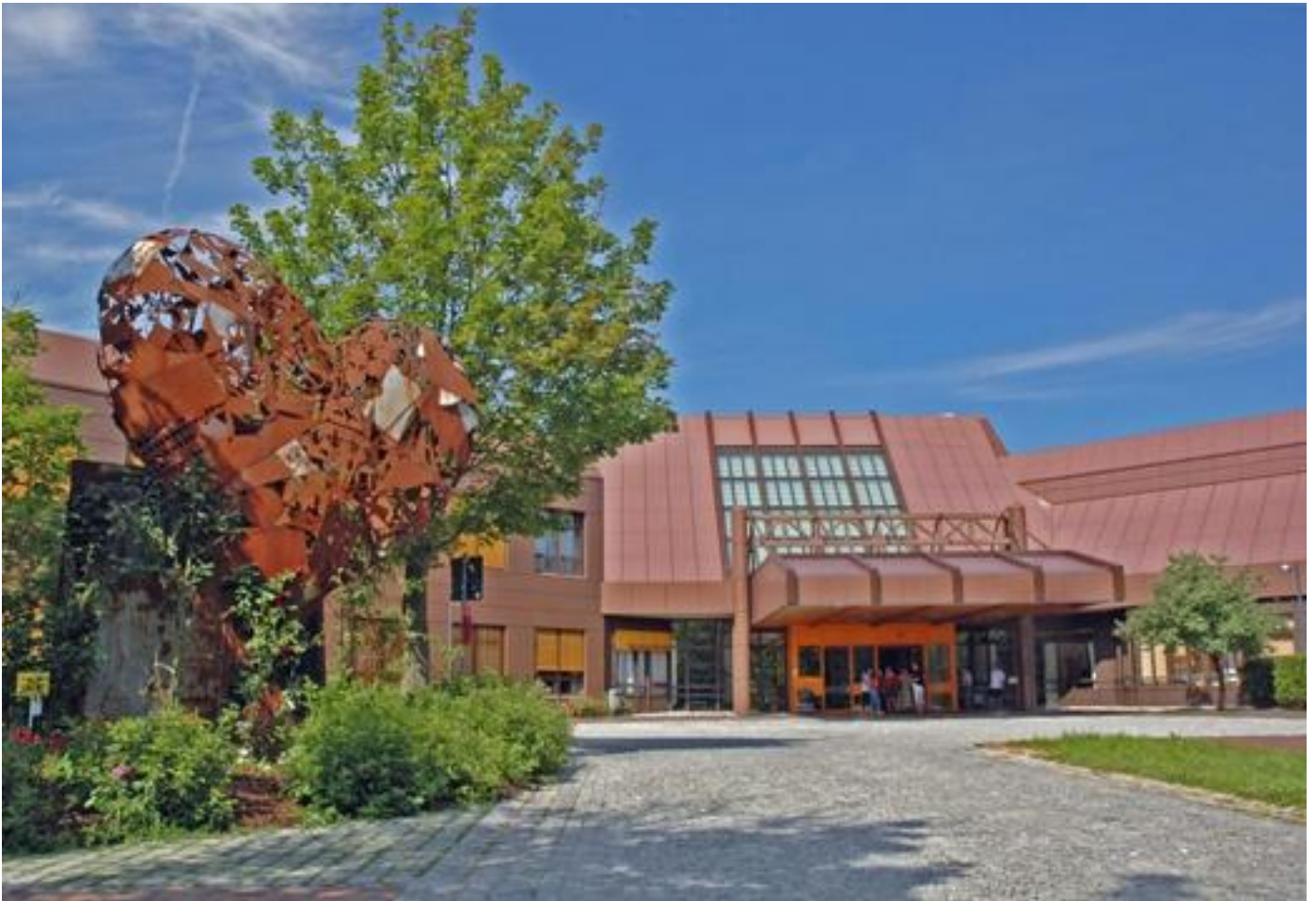
Abbildung: Haupteingang Kreisklinik Altötting

Hiermit dürfen wir den nach §137 Sozialgesetzbuch V vorgeschriebenen strukturierten Qualitätsbericht der Kreisklinik Altötting vorlegen.