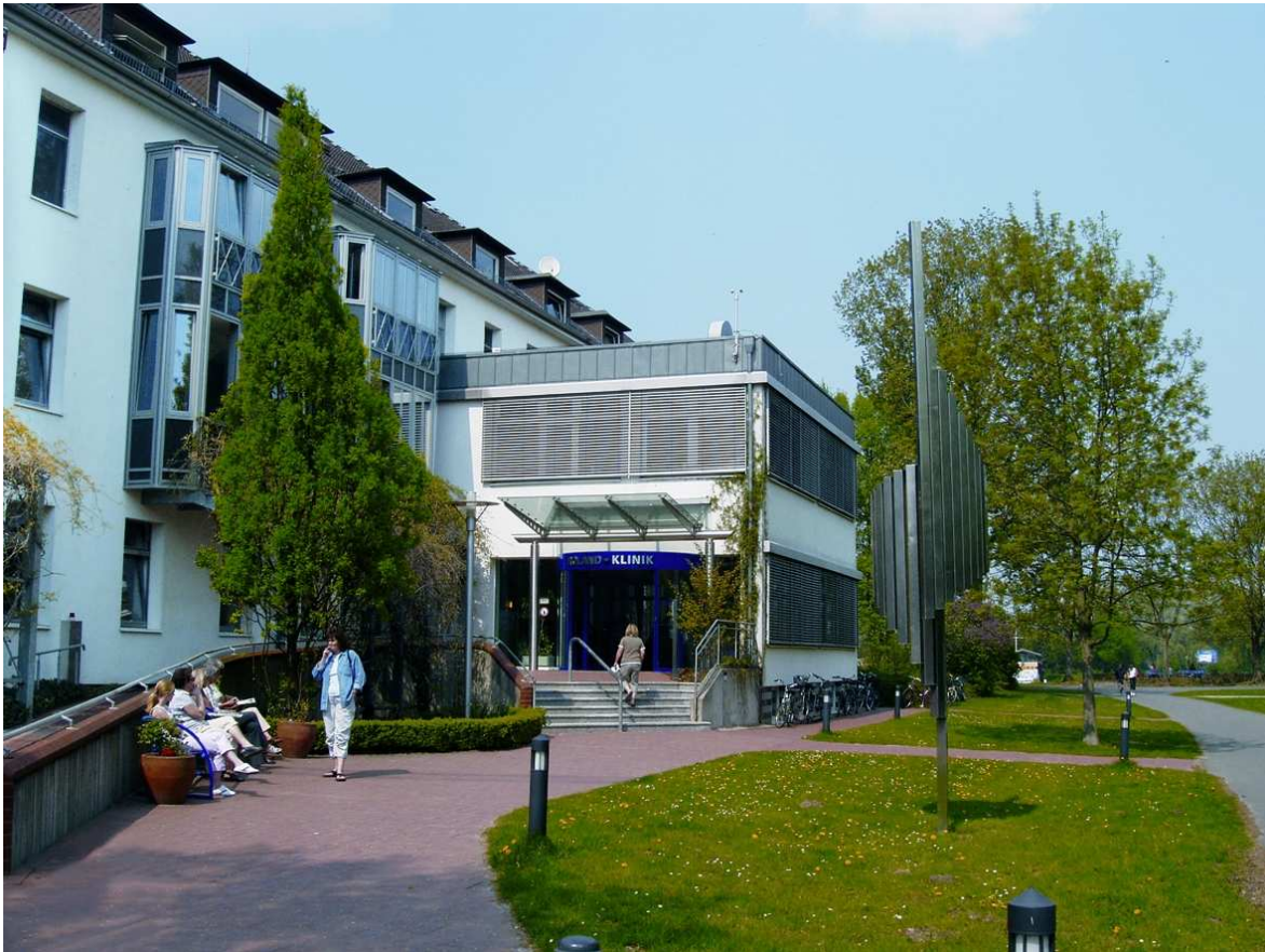
Abbildung: Auf dem Foto wird der Eingangsbereich der Roland-Klinik dargestellt. Der Treppenaufgang sowie die Behindertenrampe sind zu erkennen. Das Gebäude liegt im Grünen direkt am Werdersee.

Die Roland-Klinik liegt direkt am Werdersee im Naherholungsgebiet der Bremer Neustadt. Seit 1971 ist die Klinik eine gemeinnützige GmbH in privater Trägerschaft. Unser Krankenhaus ist im Bettenbedarfsplan des Bundeslandes Bremen ausgewiesen.