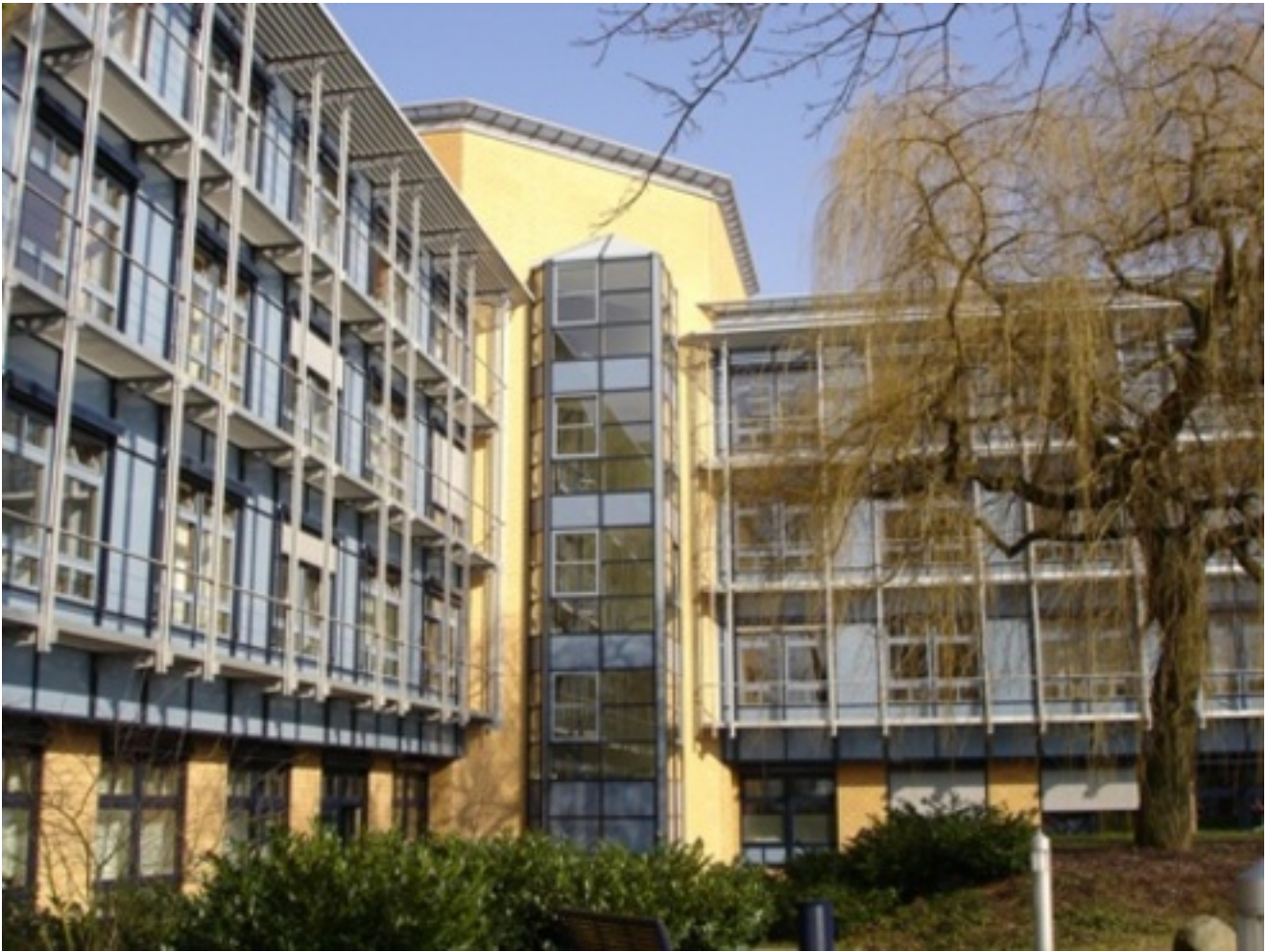
Abbildung: Bettenhaus St. Georg Klinikum Eisenach

Das St. Georg Klinikum Eisenach befindet sich, wie auch das Gesundheitswesen insgesamt, im Wandel. Durch die sich verändernden Rahmenbedingungen im Gesundheitswesen stehen unsere Mitarbeiterinnen und Mitarbeiter im St. Georg Klinikum Veränderungen gegenüber, die sie zum Wohle unserer Patienten sowie ihrer Angehörigen und einer hochwertigen medizinischen Versorgung in Westthüringen gestalten.