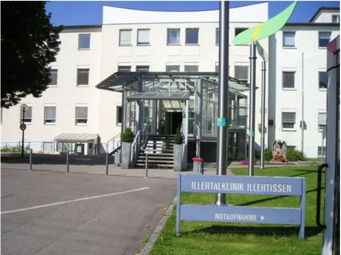
Abbildung: Eingang Illertalklinik Illertissen