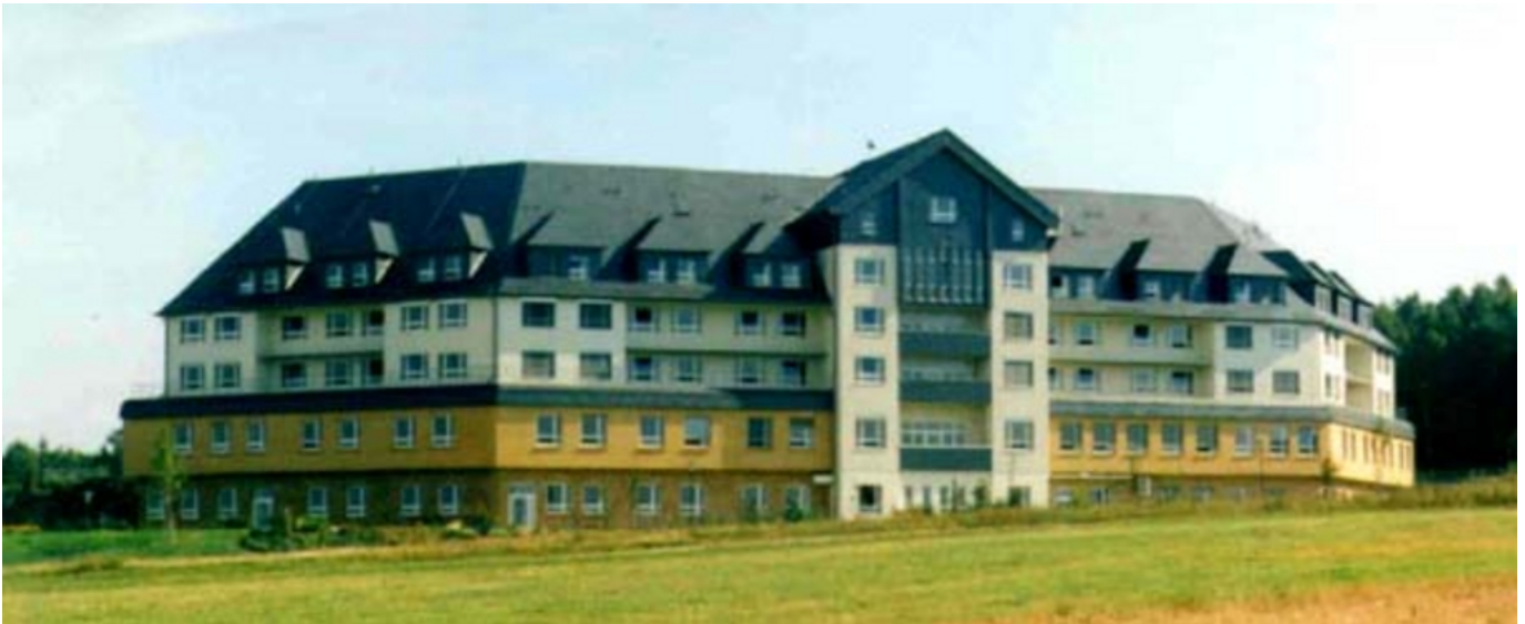
Abbildung: KKH Kirchberg