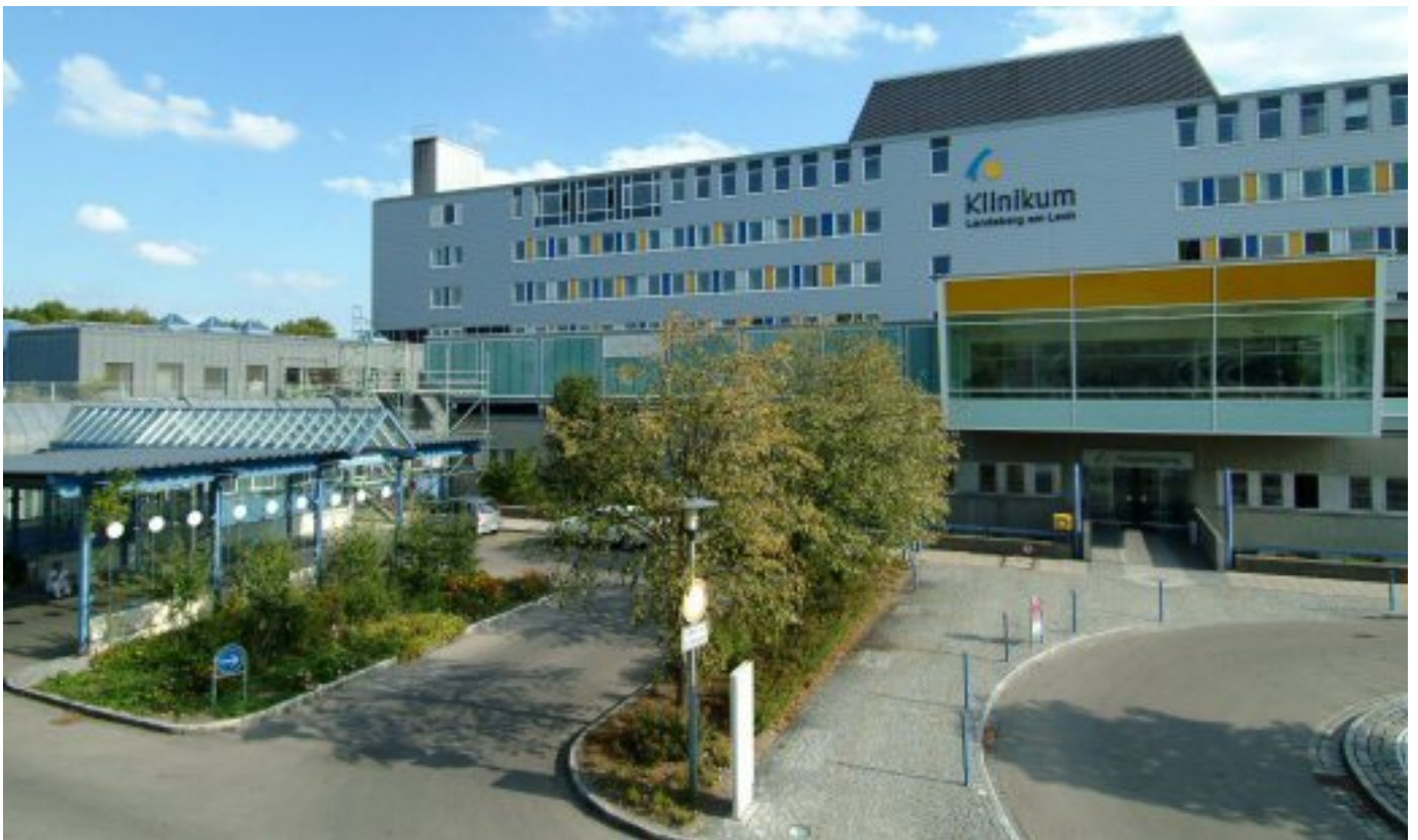
Abbildung: Gesamtansicht des Klinikum Landsberg