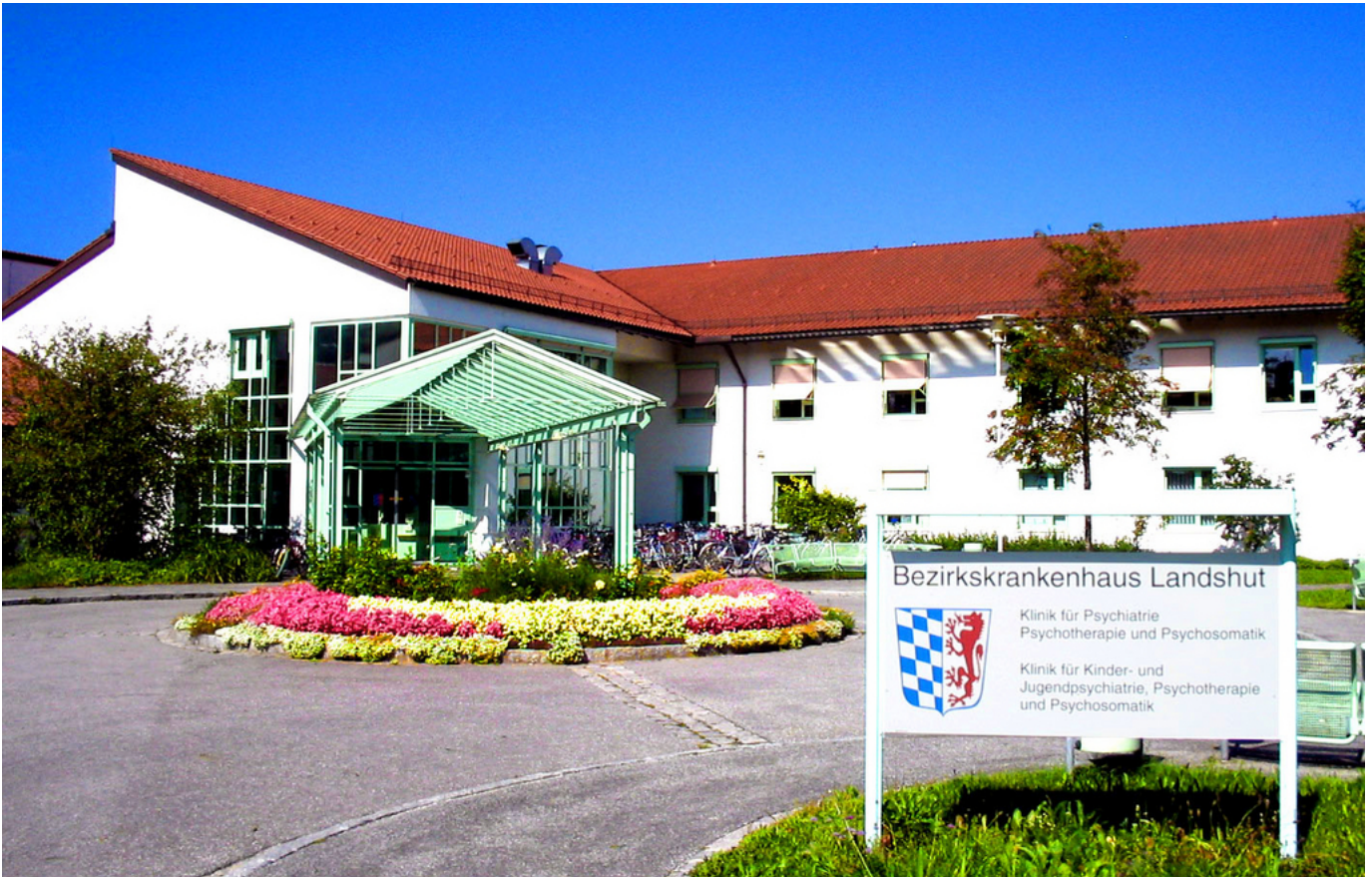
Abbildung: Das BKH Landshut ist ein modernes psychiatrisch-psychosomatisches Krankenhaus, das von einer schönen Gartenanlage umgeben ist. Fünf zweistöckige Häuser sind um einen Zentralbau gruppiert und mit diesem durch verglaste Gänge verbunden.

Unter dem Dach des Bezirkskrankenhauses Landshut sind die Kliniken für Psychiatrie, Psychotherapie und Psychosomatik für Erwachsene sowie für Kinder und Jugendliche vereint.