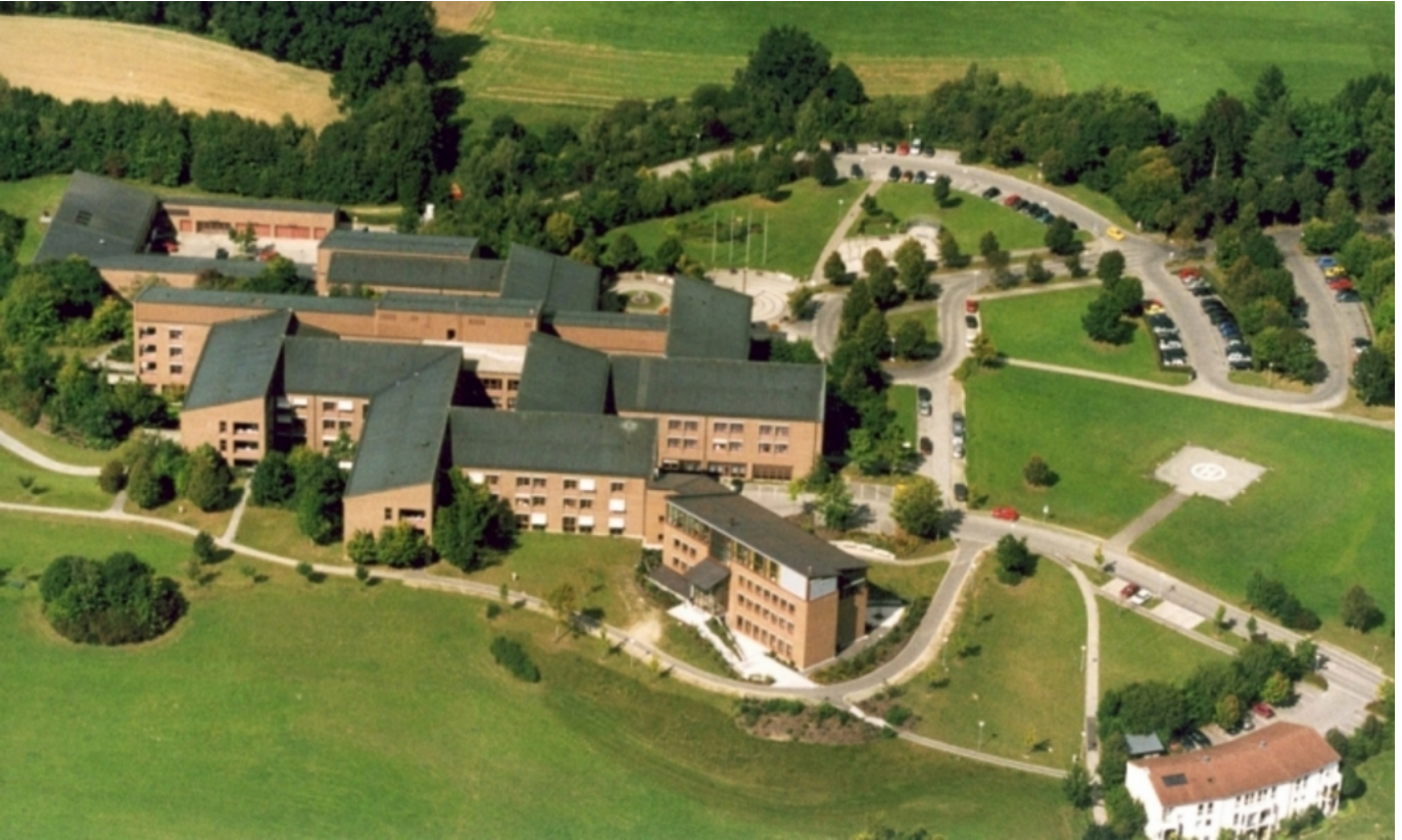
Abbildung: Luftaufnahme der Klinik