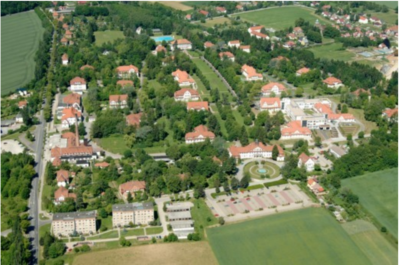
Abbildung: Gesamtanlage des Ökumenischen Hainich Klinikum in Mühlhausen/Thüringen

Liebe Patientin, Lieber Patient, Lieber Leser,