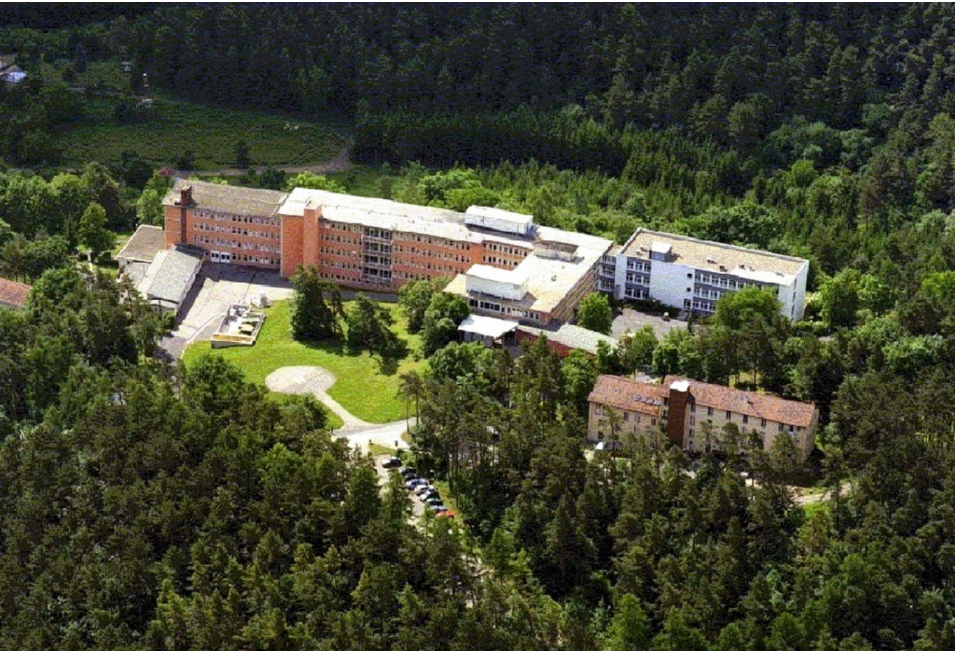
Abbildung: Die Klinik Michelsberg - Fachkrankenhaus für Lungen- und Bronchialheilkunde, Thoraxchirurgie, pneumologische Onkologie, Tuberkulose, Schlaf- und Beatmungsmedizin in Trägerschaft des Bezirks Unterfranken liegt am Fuße zur Bayerischen Rhön.

Die Klinik Michelsberg – Fachkrankenhaus für Lungen- und Bronchialheilkunde, Thoraxchirurgie, pneumologischer Onkologie und Schlaf- und Beatmungsmedizin in der Trägerschaft des Bezirks Unterfranken – stellt sich aktiv den aktuellen Herausforderungen des Gesundheitssystems.