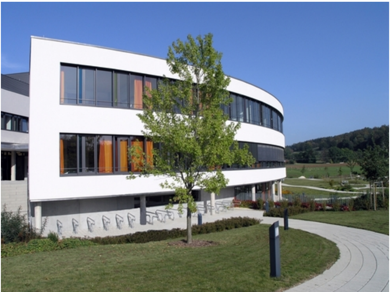
Abbildung: Albklinik Münsingen Lautertalstraße 47, 72525 Münsingen