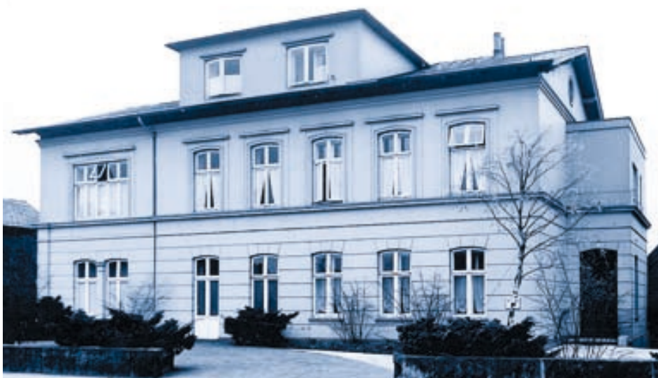
Die Klinik 1959