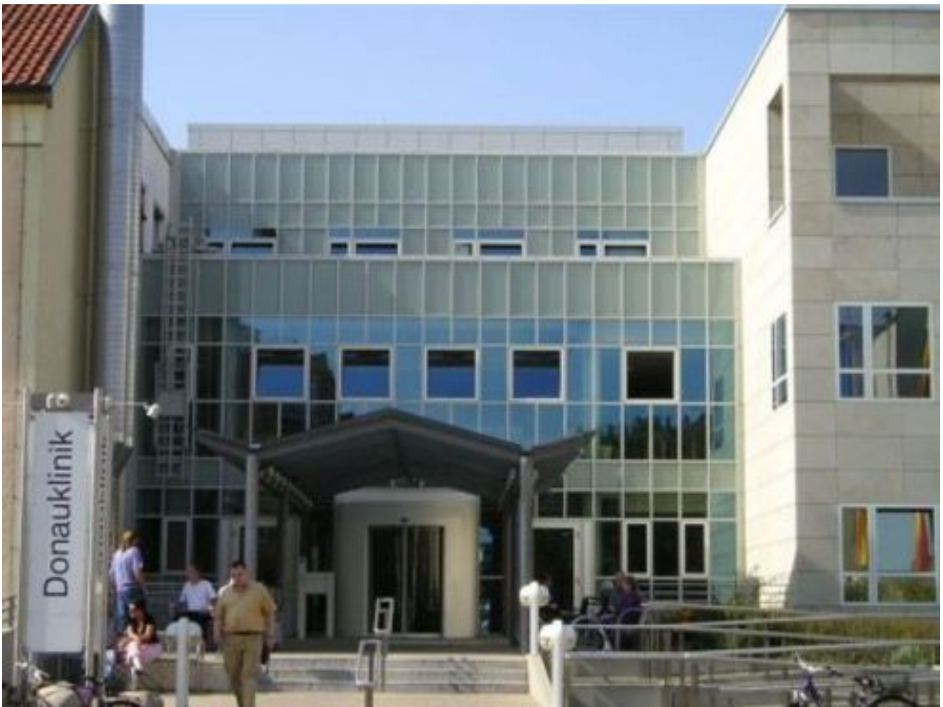
Abbildung: Eingang Donauklinik