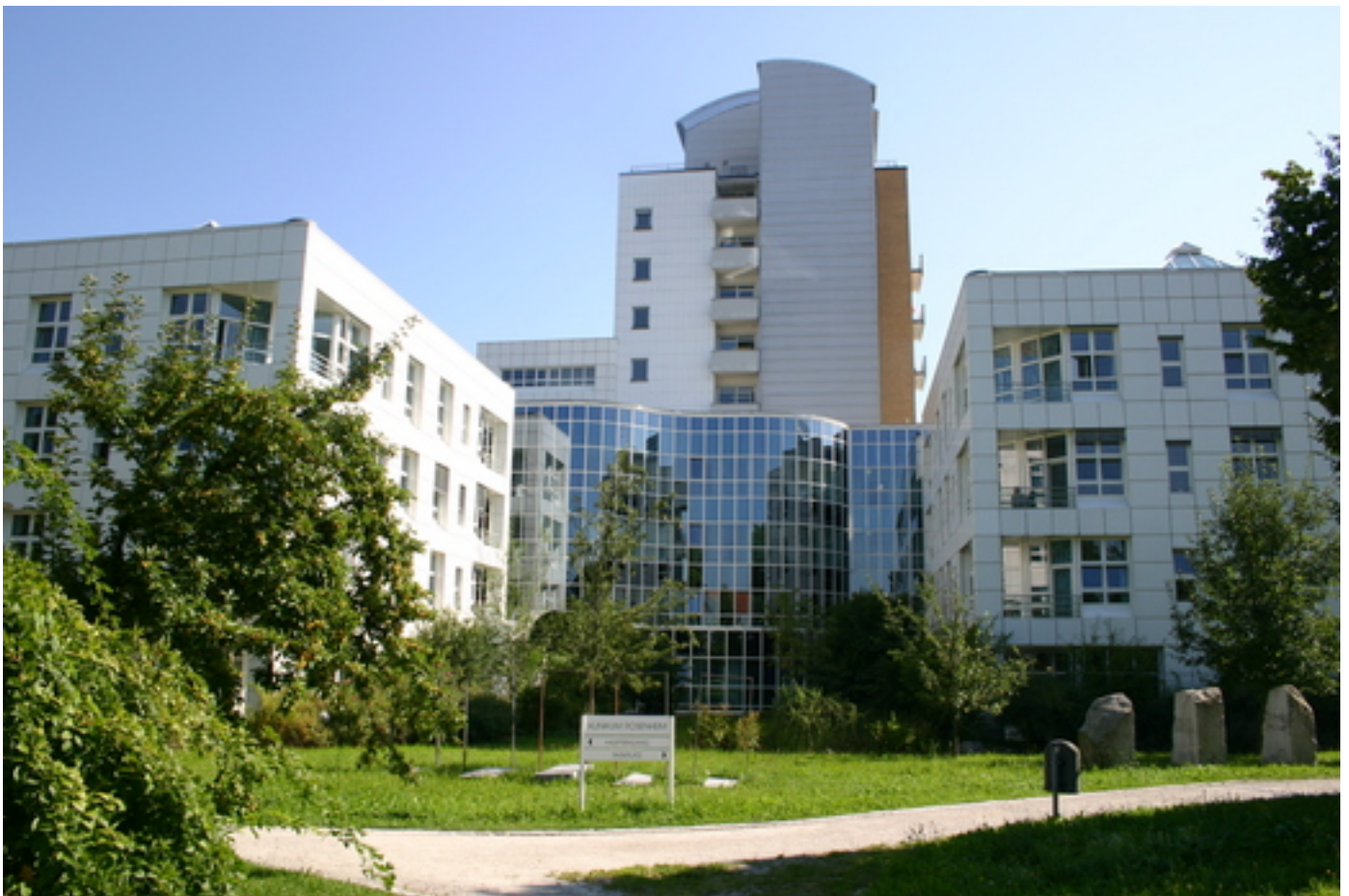
Abbildung: Klinikum Rosenheim