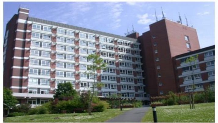
Abbildung: Vorder-und Rückseite des Elbe Klinikum Stade