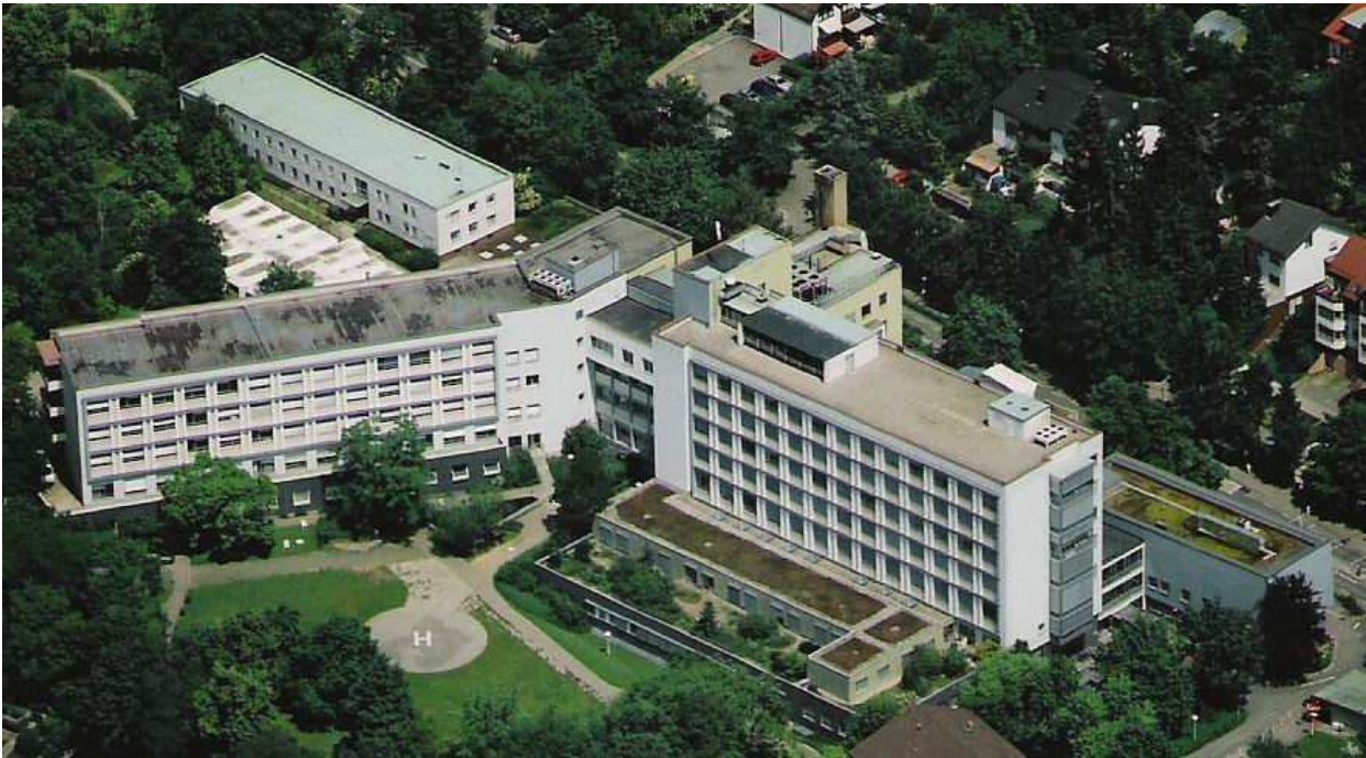
Abbildung: Luftaufnahme Kreiskrankenhaus Waiblingen