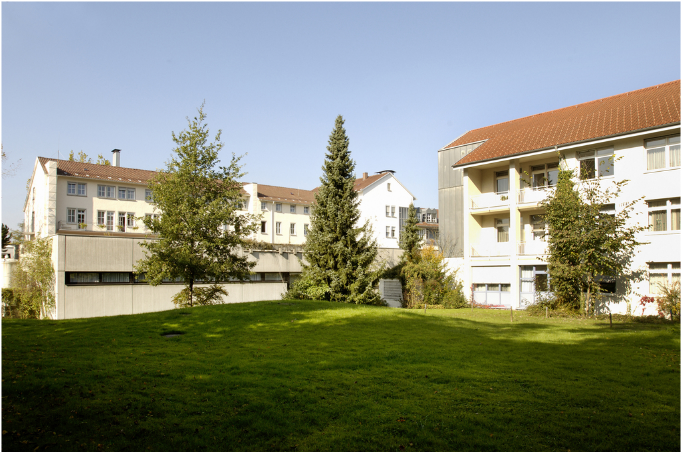
Abbildung: Krankenhaus 14 Nothelfer Weingarten