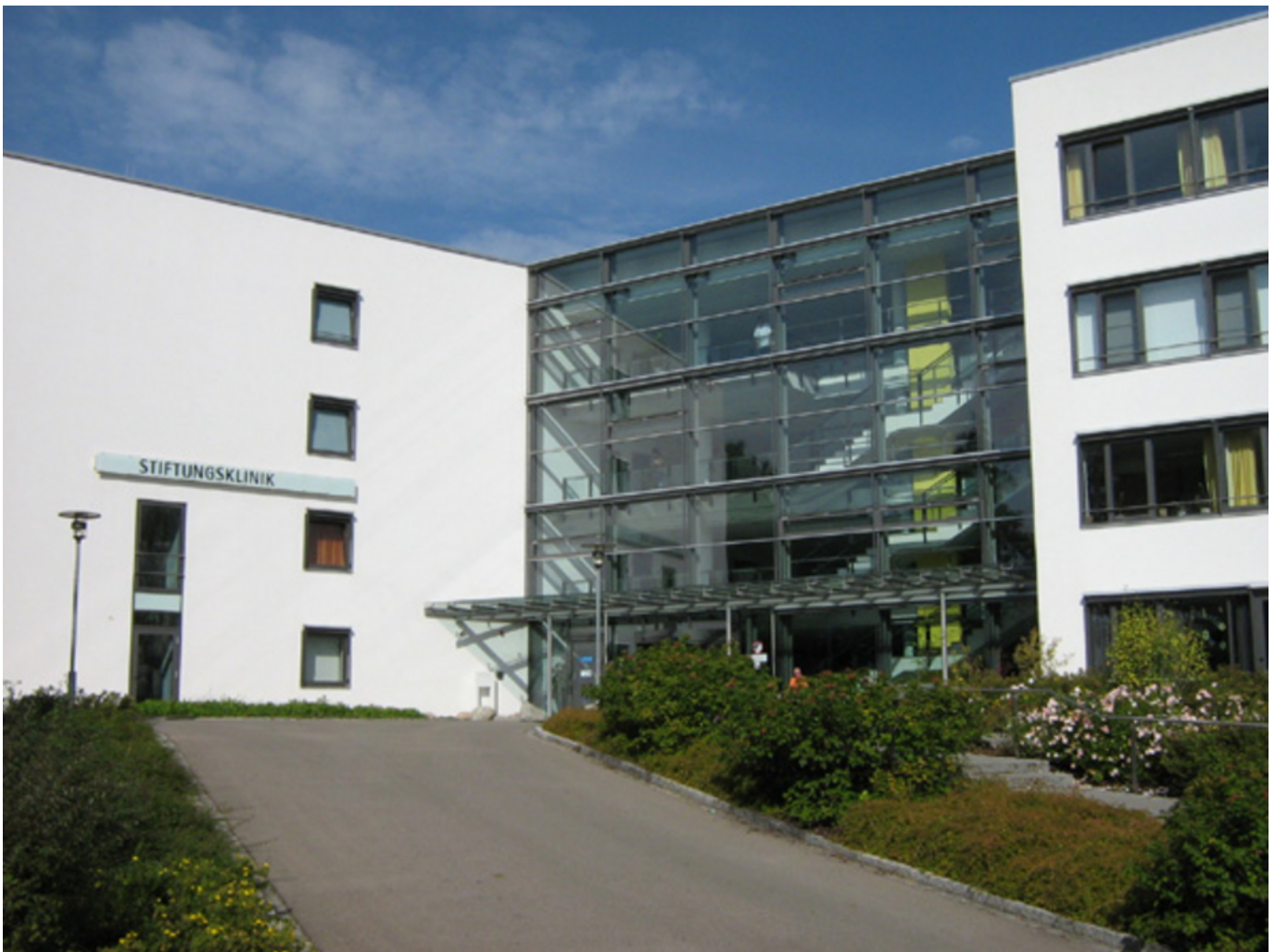
Abbildung: Eingangsbereich Stiftungsklinik Weißenhorn