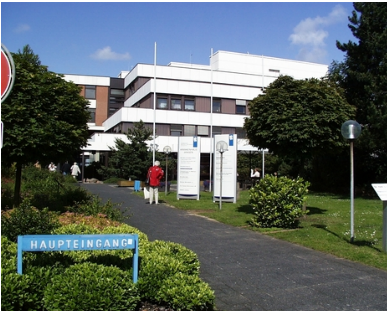
Abbildung: Krankenhaus Winsen ( Luhe )

Wir freuen uns, Ihnen hiermit den zweiten Qualitätsbericht über unser Haus vorzulegen.