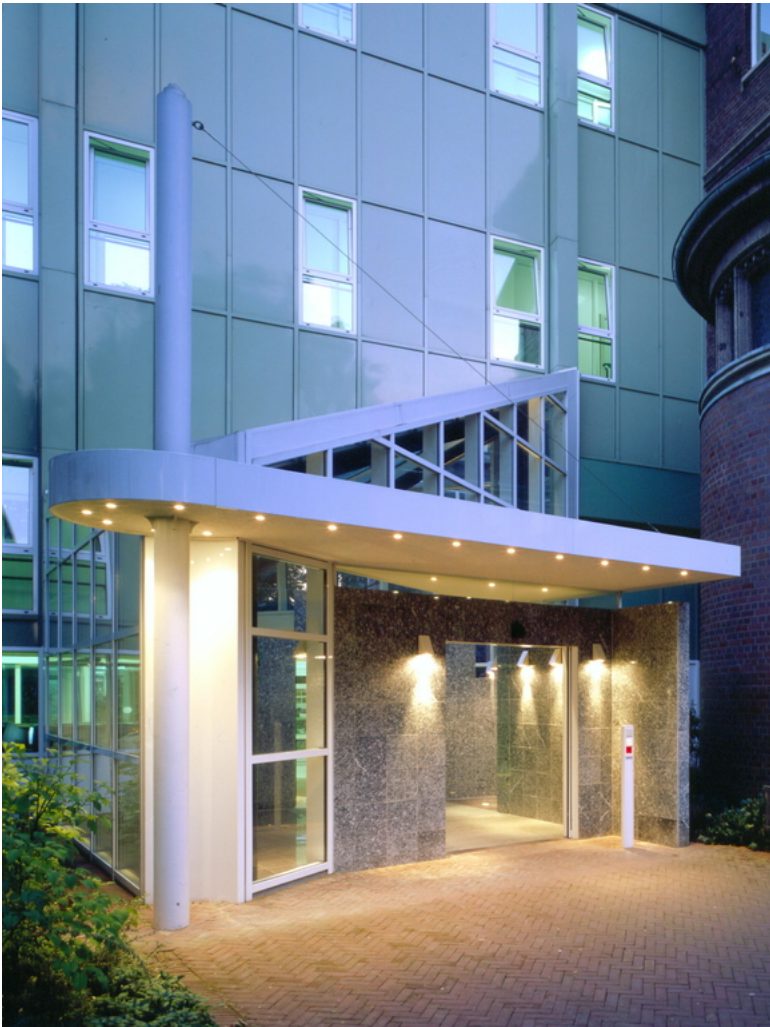
Abbildung: Haupteingang der Krankenhaus Maria-Hilf GmbH Krefeld