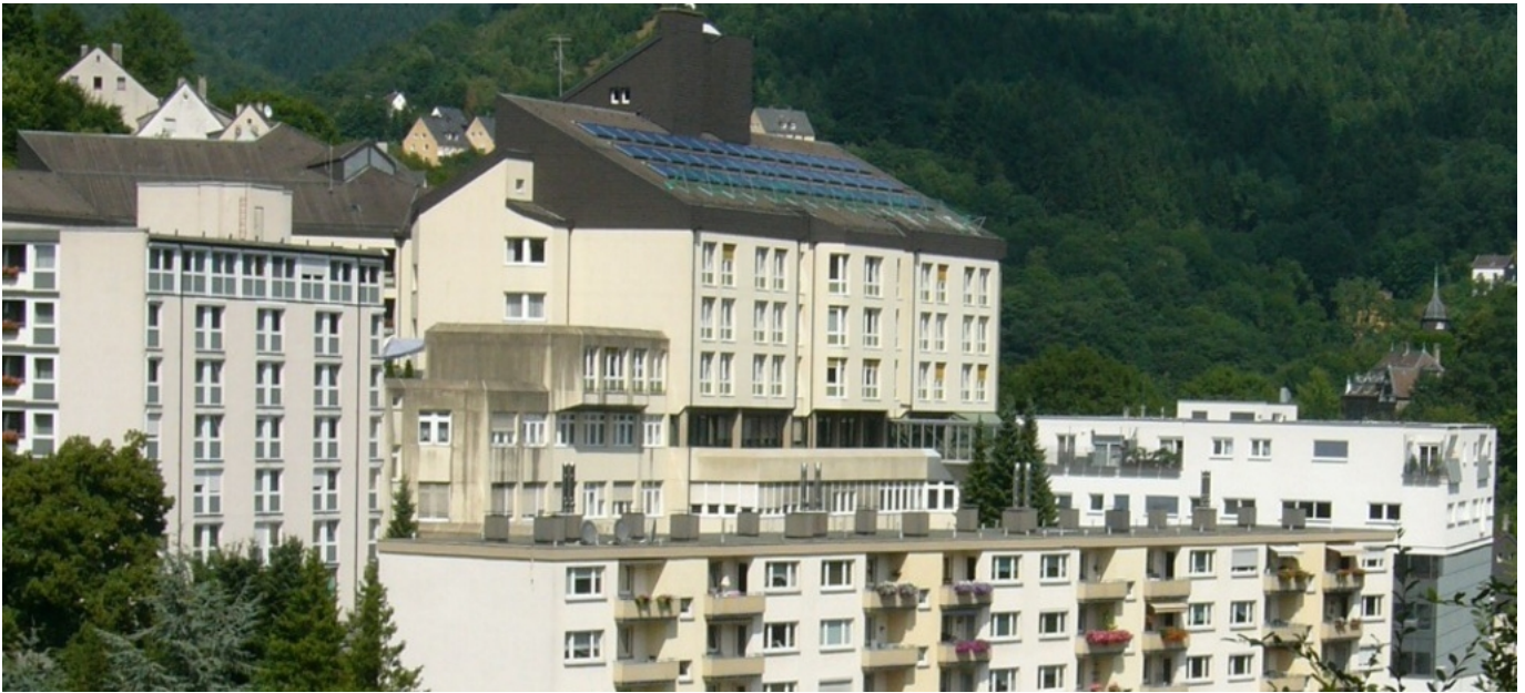
Abbildung: St. Vinzenz Krankenhaus Altena

Sehr geehrte Leserin, sehr geehrter Leser,