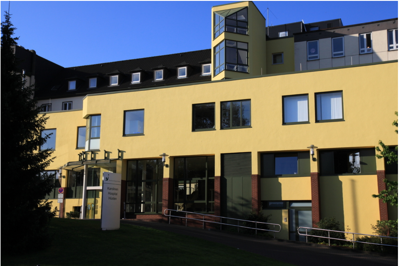
Abbildung: Der Haupteingang zum Karolinen-Hospital Hüsten

Sehr geehrte/r LeserIn unseres Qualitätsberichtes,