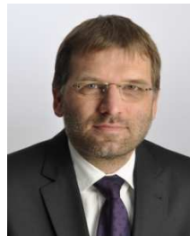
Dr. K. Kutzner Medizincontrolling