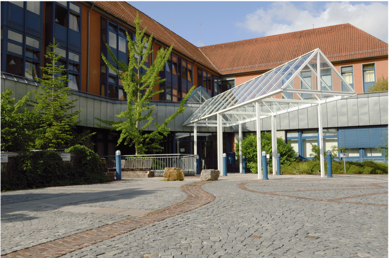
Abbildung: Kreisklinik gGmbH Bad Neustadt a. d. Saale

Die Kreisklinik gGmbH Bad Neustadt a. d. Saale ist eine Klinik der Grund- und Regelversorgung und verfügt seit dem 01.04.2007 über 225 stationäre und 8 teilstationäre Dialyseplätze. Seit September 2010 zählt noch die Palliativstation mit 6 Betten dazu. Neben der Inneren Medizin mit Schwerpunkt Gastroenterologie und Nephrologie sind Abteilungen für Allgemein-, Viszeral- und Thoraxchirurgie, Unfall- und Wiederherstellungschirurgie, Anästhesie und Intensivmedizin vertreten, sowie Belegabteilungen für Gynäkologie/Geburtshilfe und HNO. Ein MVZ mit orthopädischem Schwerpunkt und eine Schwerpunktambulanz Hämatologie und Onkologie sind ebenfalls angegliedert.