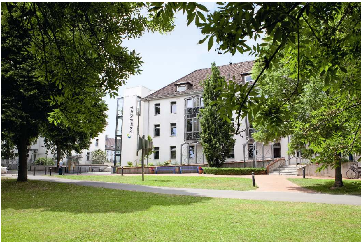
Abbildung: Frontansicht Roland Klinik