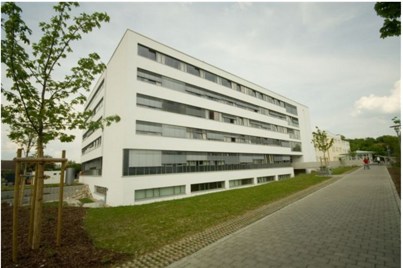
Abbildung: Illertalklinik Illertissen