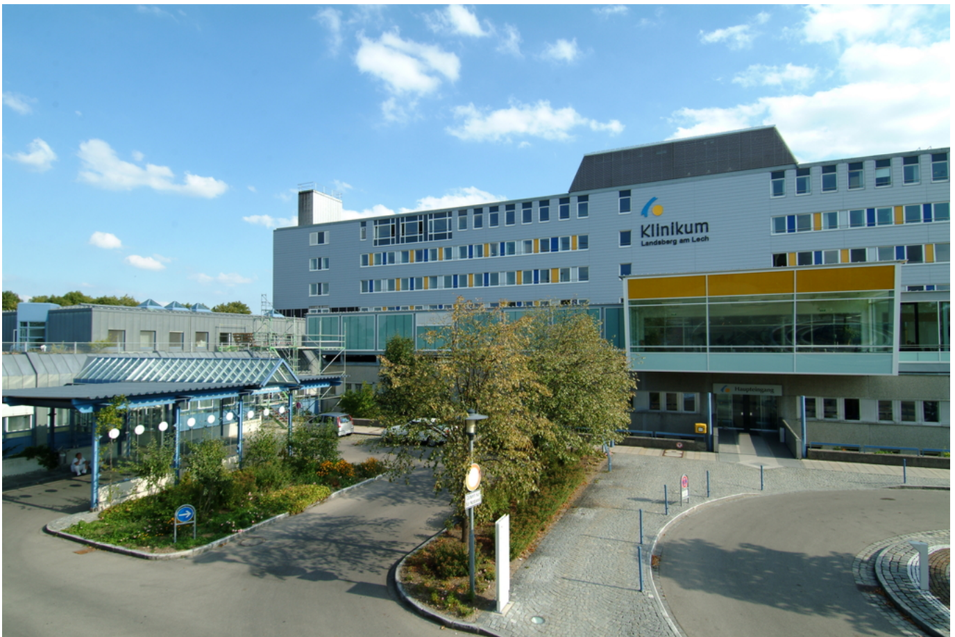
Abbildung: Klinikum Landsberg am Lech

Mit dem vorliegenden Qualitätsbericht kommen wir unserer gesetzlichen Pflicht zur Veröffentlichung nach. Wir bedanken uns für das gezeigte Interesse und wünschen eine interessante Lektüre.