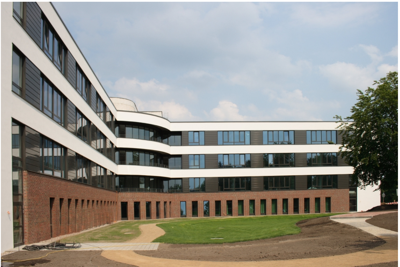
Abbildung: Abbildung: Friedrich Ebert Krankenhaus Neumünster