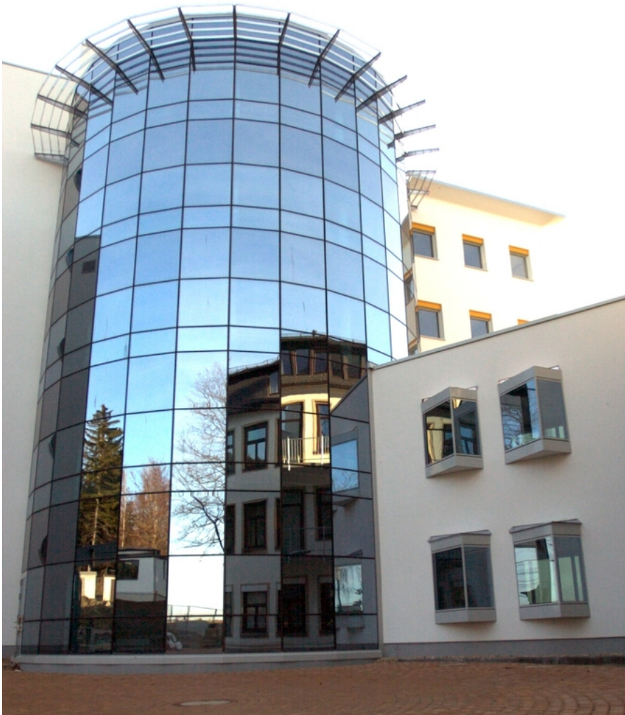
Abbildung: Funktionsneubau am Klinikum Obergöltzsch

Sehr geehrte Leserin, sehr geehrter Leser,