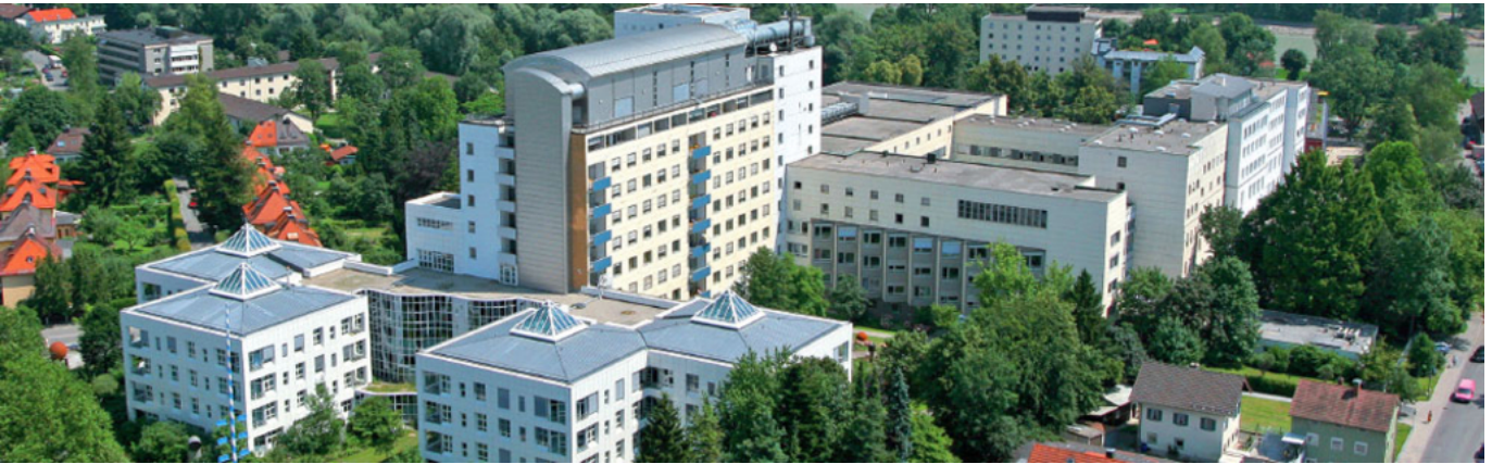
Abbildung: RoMed Klinikum Rosenheim