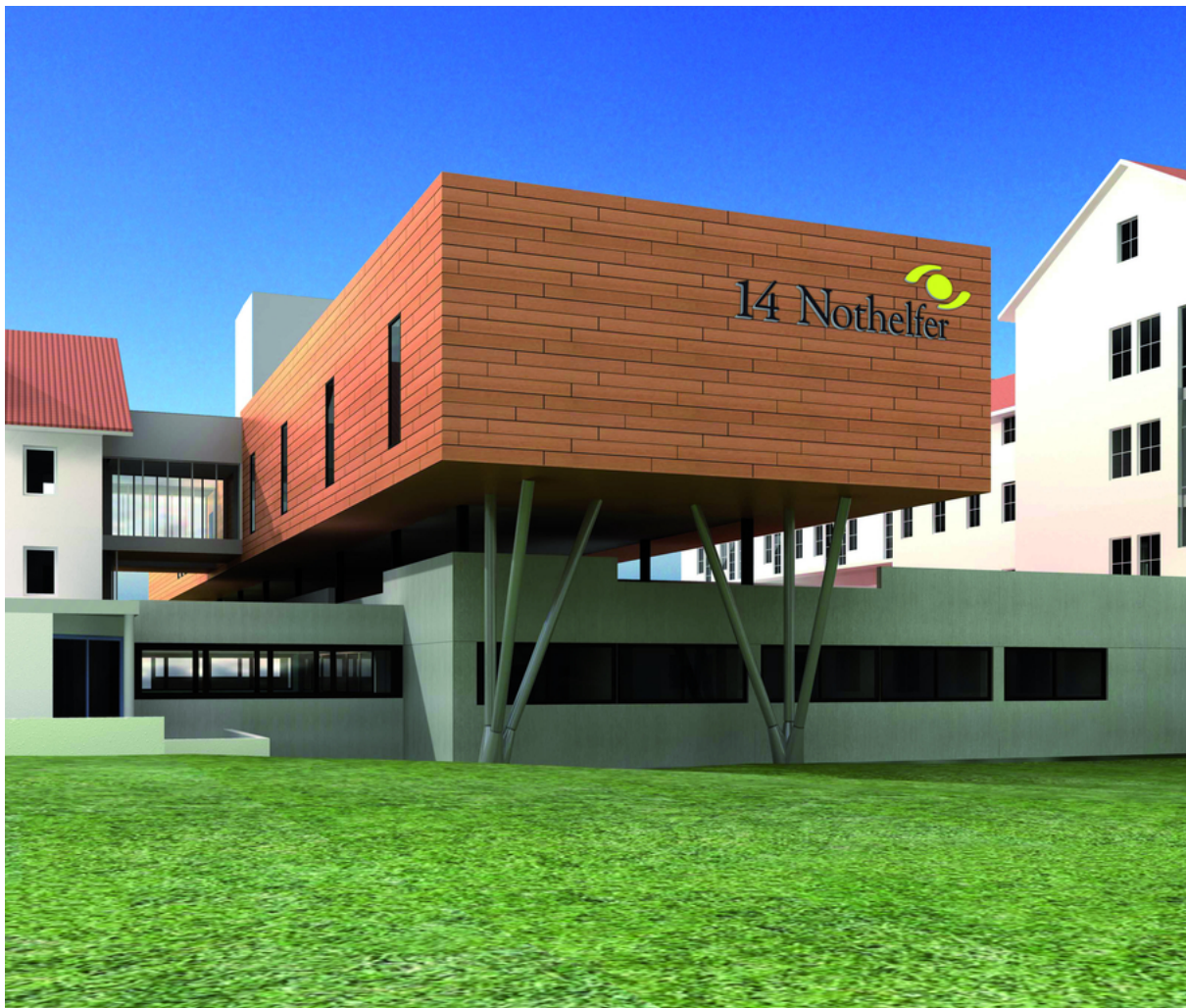
Abbildung: Krankenhaus 14 Nothelfer Weingarten mit neuem OP-Trakt