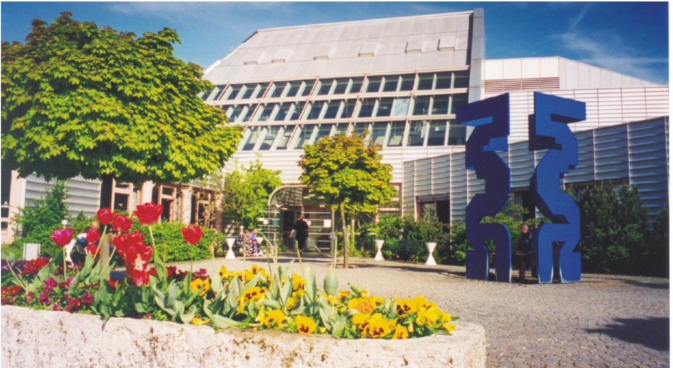
Abbildung: Kreisklinik Weißenburg

Die Kreisklinik Weißenburg ist ein modern ausgestattetes Haus der Grund- und Regelversorgung mit 190 Planbetten und bildet zusammen mit der Kreisklinik Gunzenhausen das Kommunalunternehmen „Kliniken des Landkreises Weißenburg-Gunzenhausen“. Im Rahmen einer seit Jahren praktizierten fachlichen Trennung und hieraus resultierenden Spezialisierung befinden sich in der Kreisklinik Weißenburg die Fachabteilungen Innere Medizin mit Schwerpunkt Gastroenterologie und Nephrologie sowie die Allgemeine Chirurgie mit Schwerpunkt Viszeral- und Thoraxchirurgie, die wiederum interdisziplinär im Bauchzentrum zusammenarbeiten. In der Kreisklinik Gunzenhausen sind die Fachbereiche Unfall-, Hand- und Wiederherstellungschirurgie/Orthopädische Chirurgie (Regionales Traumazentrum im Traumanetzwerk Mittelfranken) und die Innere Medizin mit Schwerpunkt Kardiologie und Angiologie angesiedelt.