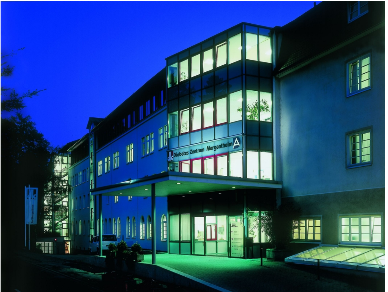
Abbildung: Diabetes Zentrum Mergentheim