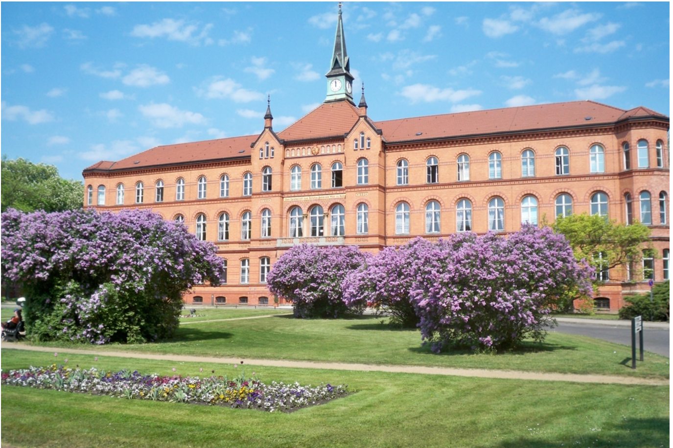
Abbildung: Evangelisches Krankenhaus Königin Elisabeth Herzberge Verwaltungsgebäude

Das Evangelische Krankenhaus Königin Elisabeth Herzberge gGmbH (KEH) ist ein modernes Krankenhaus im Berliner Bezirk Lichtenberg und verfügt über 587 ordnungsbehördlich genehmigte Betten, einschließlich 10 Dialyseplätze, in insgesamt 10 Fachabteilungen sowie zwei psychiatrische Tageskliniken.