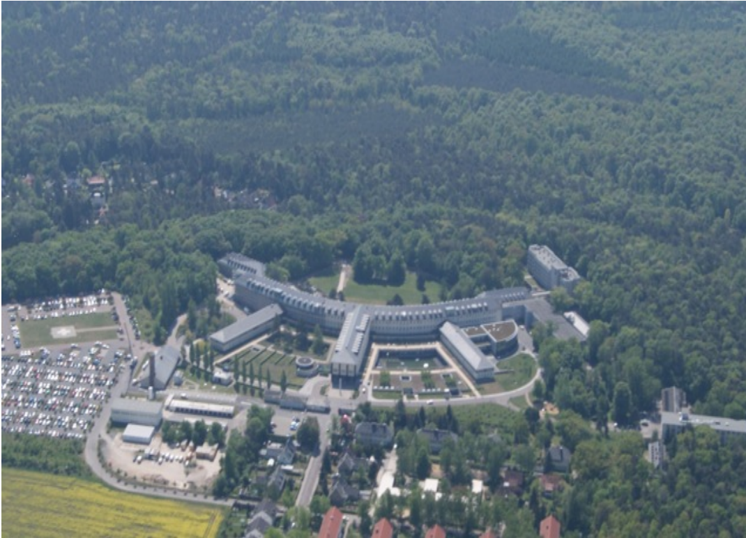
Abbildung: Luftaufnahme Martha-Maria Krankenhaus Halle-Dörlau

Das Krankenhaus Martha-Maria Halle-Dörlau ist eine Einrichtung im Diakoniewerk Martha-Maria, einem selbstständigen Unternehmen in der Evangelisch-methodistischen Kirche, die zur Arbeitsgemeinschaft Christlicher Kirchen gehört. Martha-Maria weiß sich dem christlichen Auftrag zur Nächstenliebe verpflichtet und ist Mitglied im Diakonischen Werk.