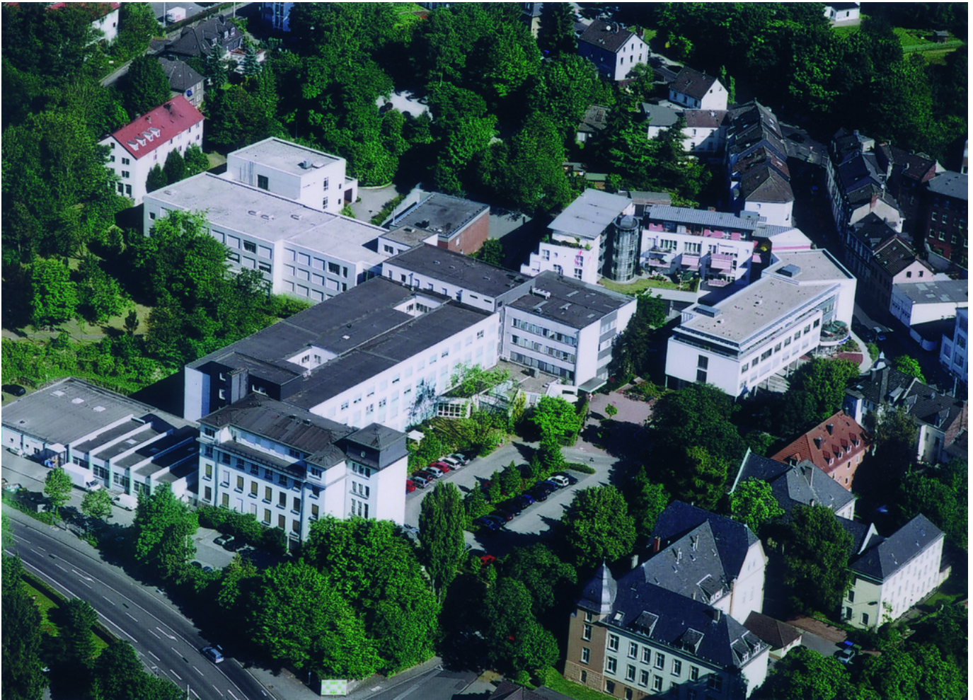
Abbildung: Die Evangelisches Krankenhaus Mettmann GmbH liegt im Zentrum der nordrhein-westfälischen Stadt Mettmann mit günstigen Verkehrsanbindungen in unmittelbarer Nähe. Geschäfte und Institutionen sind zu den üblichen Öffnungszeiten sehr gut zu erreichen.