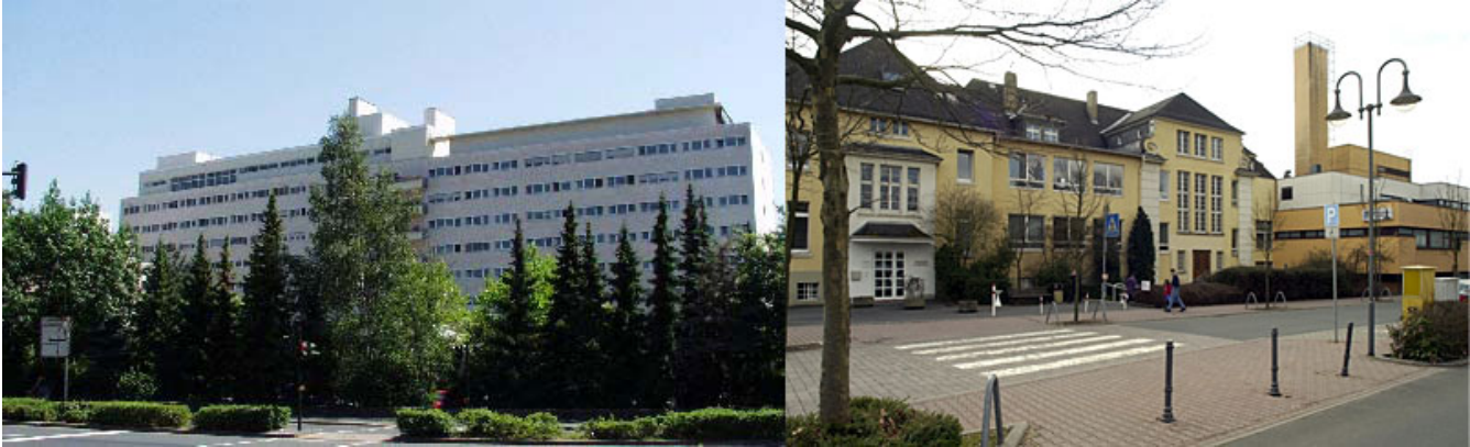
Abbildung: Hochttaunus - Kliniken Bad Homburg und Usingen

Die Hochttaunus - Kliniken gGmbH vereint die Krankenhäuser Bad Homburg und Usingen unter ihrem Dach. Als akademisches Lehrkrankenhaus der Universitätskliniken Gießen und Frankfurt am Main mit 495 Betten für die akutmedizinische Versorgung ist sie der Schwerpunktversorger im Hochttaunuskreis.